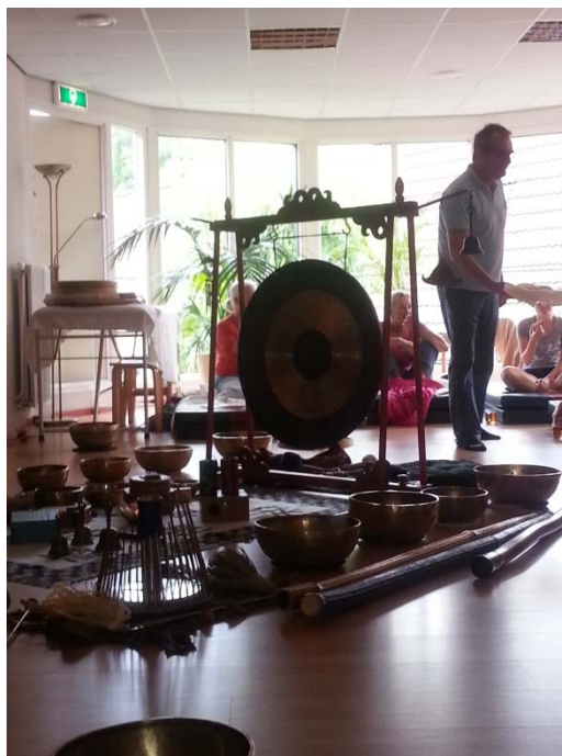
Dreamtime healing concert

De opleiding zal ook mensen aanspreken die hun leven een positieve wending willen geven maar niet streven naar het certificaat. Deelname aan de eerste module van de opleiding houdt dus niet de verplichting in, dat men ook deelneemt aan het tweede module en/of het examen!